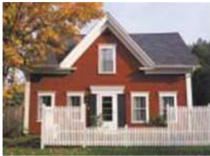
الحصول على تصريح بموجب قانون وكالة Adirondack Park Agency.

يجب على مالك الأراضي، داخل هذه البلدات، دائماً استشارة مسؤول الكود المحلي أو مسؤول الإنفاذ، بالإضافة إلى وكالة Adirondack Park Agency، في تلك الظروف التي تشير فيها الإرشادات وقوائم المراجعة التالية إلى أنه قد يكون مطلوباً